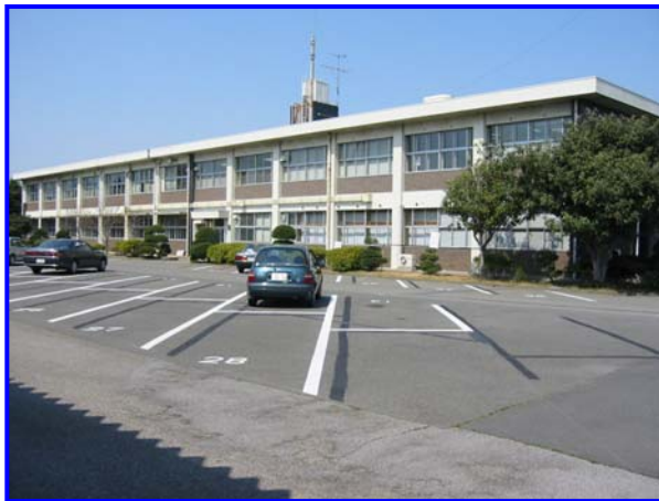
埼玉県NPOオフィスプラザ全景